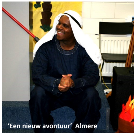
'Een nieuw avontuur' Almere