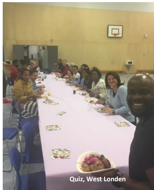
Quiz, West Londen