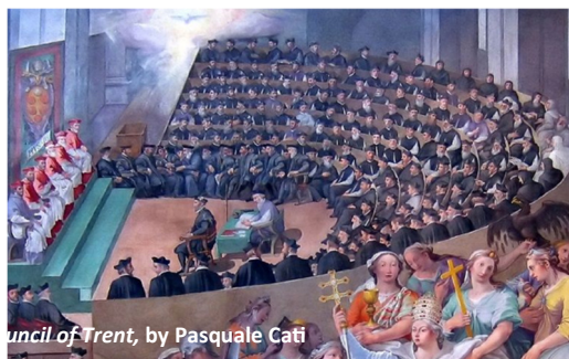
Concilie van Trente, by Pasquale Cati

Concilie van Trente (1545–1563, (met onderbrekingen) gaat over kerk hervorming en afgewezen Protestantisme, bepaalde de rol en canon van de Schrift en de 7 sacramenten en