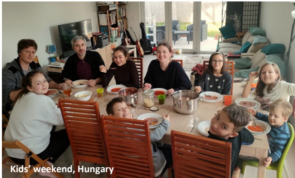
Kids' weekend, Hungary