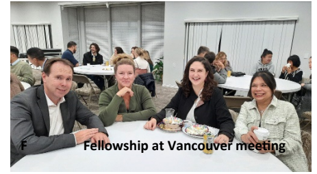
Fellowship at Vancouver meeting

heel blij voor hen en wensen hen een gezegend leven, samen met de Heer.