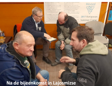
Na de bijeenkomst in Lajosmizse

vonken en splinters kwamen in zijn ogen, maar hij bad ervoor en het was oké.