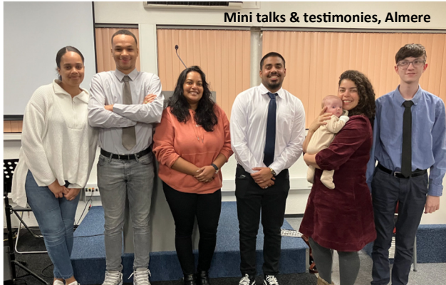
Mini talks & testimonies, Almere