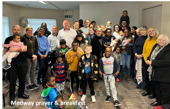
Medway prayer & breakfast