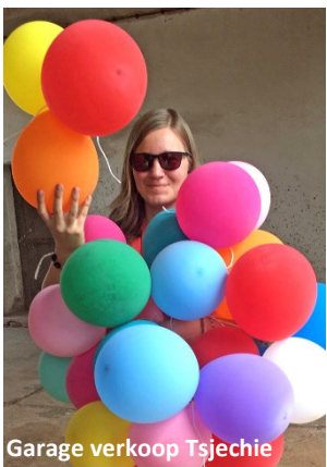
Garage verkoop Tsjechie

We konden gelukkig weer bijeenkomsten gaan houden op zondag, dat is echt fantastisch. De bidbijeenkomst op dinsdag is in een andere hal waar 30 broeders en zusters in kunnen en op donderdag hebben we nog steeds een Zoom bijeenkomst. Een broeder had continu last van zijn rug met autorijden, maar na gebed was hij genezen. Een zuster bood gebed aan voor de vader van een mede studente op de universiteit en hoorde twee weken later, dat op de tijd van het gebed de