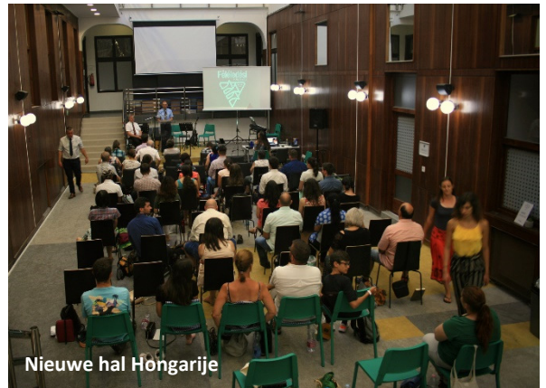
Nieuwe hal Hongarije