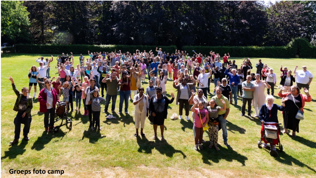
Groeps foto camp