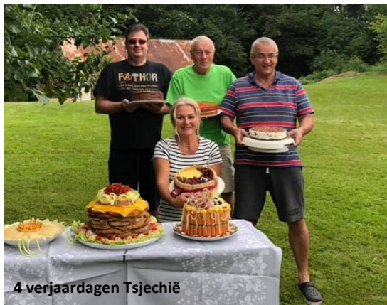
4 verjaardagen Tsjechië