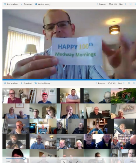
100e Medway Morning

gevraagd via Zoom, door een zuster in Australië voor een collega die kanker had en ook zwanger was. Het beste wat de doctoren konden hopen was dat het zou slinken, want chemo was niet mogelijk door de zwangerschap. Recent weer een scan gemaakt en de tumor is verdwenen. Prijs de Heer! Onze zuster in Australië had ook op Facebook geschriften gepost die haar collega steeds "liked". Dit laat zien dat de moderne technologie ook positief kan zijn, als we het gebruiken in het voordeel van het evangelie, dat is heel bemoedigend.