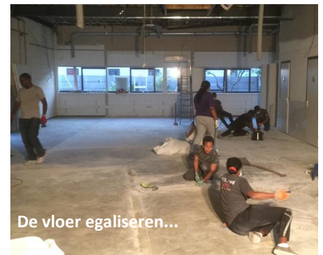
De vloer egaliseren...