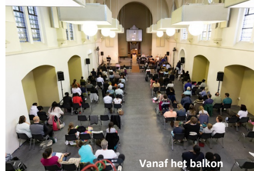
Vanaf het balkon