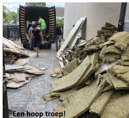
Een hoop troep!