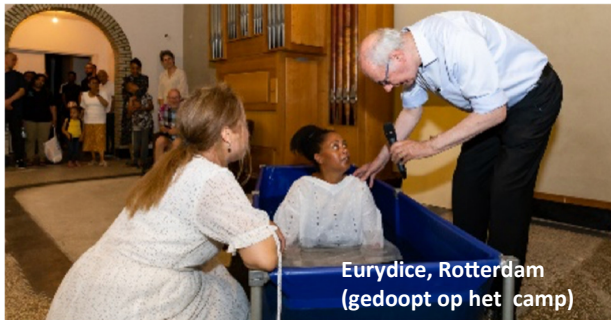
Eurydice, Rotterdam (gedoopt op het camp)