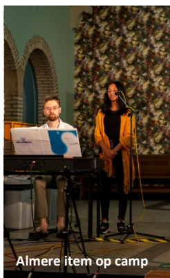
Almere item op camp

willen, maar zolang als we bereid zijn om onze wegen aan te passen aan Gods wegen, zal er altijd een goed resultaat zijn en kunnen er mensen gered worden. We zijn vrij om te kiezen of we deel willen uitmaken van Gods plan, dus laten we verstandig kiezen en blij aan de slag gaan met het redden van zielen!