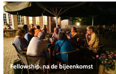
Fellowship na de bijeenkomst