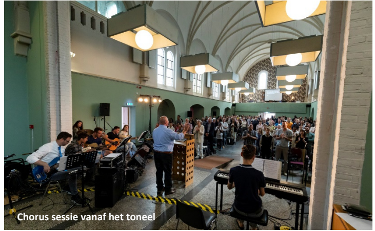
Chorus sessie vanaf het toneel