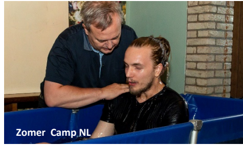
Zomer Camp NL