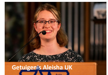
Getuigenis Aleisha UK