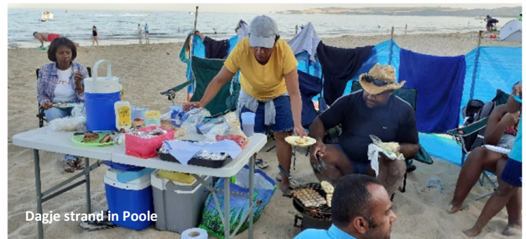
Dagje strand in Poole