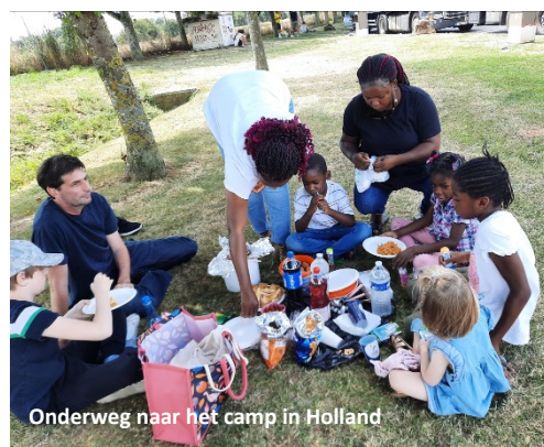
Onderweg naar het camp in Holland

We besloten deze maand door naar het zomer camp in Nederland te reizen, we