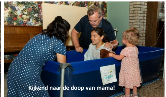
Kijkend naar de doop van mama!