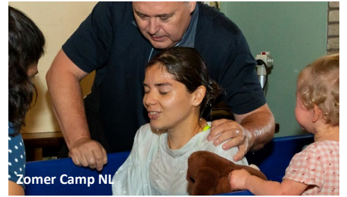
Zomer Camp NL