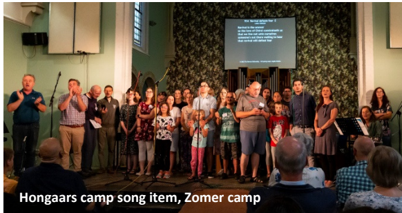
Hongaars camp song item, Zomer camp

bemoedigende gesprekken en 's morgens discussies, 's middags outreaches en 's avonds presentaties in het lokale