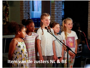
Item van de zusters NL & BE