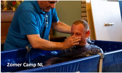
Zomer Camp NL