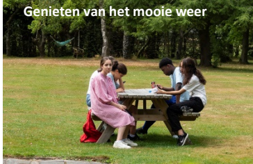
Genieten van het mooie weer