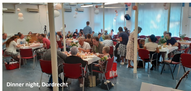
Dinner night, Dordrecht