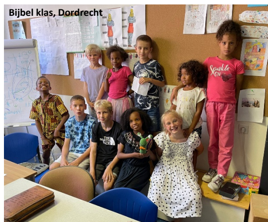
Bijbel klas, Dordrecht

We hebben steeds bezoekers die komen kijken wat we doen en wie we zijn, van outreaches en persoonlijke contacten.