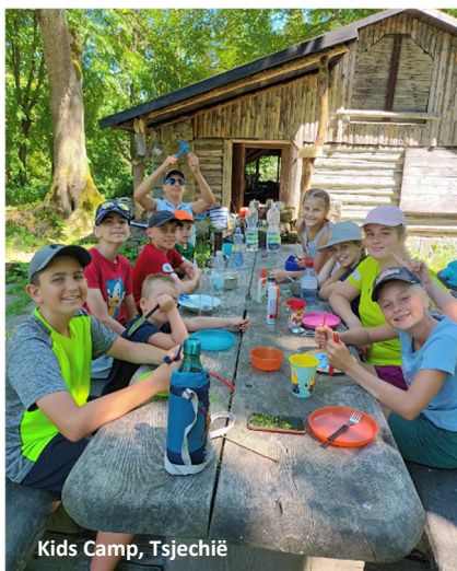
Kids Camp, Tsjechië