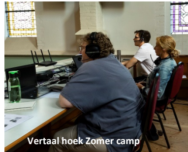
Vertaal hoek Zomer camp

gemeenschapshuis. Er kwamen twee bezoekers van de outreaches en we hebben een aantal contacten voor follow-up. Een groep van 24 broeders en zusters ging op kano trip in de wildernis, dat was een goede oefening in teamwork, het was leuk en avontuurlijk en er waren ook geestelijke lessen te leren. Ons weekend van bidden en vasten ging helemaal over hoe we Gods werk beter kunnen doen. We hadden ook weer een schilder evenement, waar ook een gast