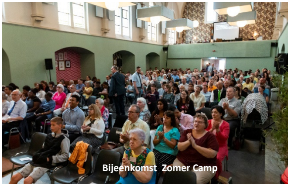
Bijeenkomst Zomer Camp