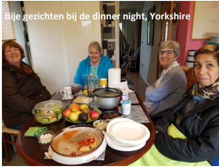
Bij gezichten bij de dinner night, Yorkshire