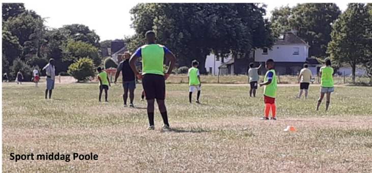
Sport middag Poole

We hebben deze maand veel tijd buiten doorgebracht en genoten van het heerlijke weer. We begonnen de maand met bidden en vasten waarbij veel broeders interessante en opbouwende gesprekken gaven. Hierna hadden we een outreach in de omgeving en 's avonds een presentatie. Tijdens één van onze donderdag outreaches werd Wendy