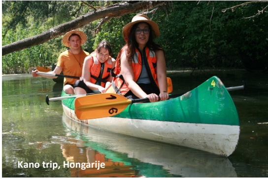
Kano trip, Hongarije