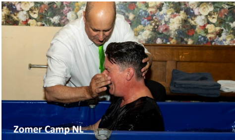
Zomer Camp NL