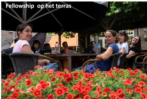
Fellowship op het terras