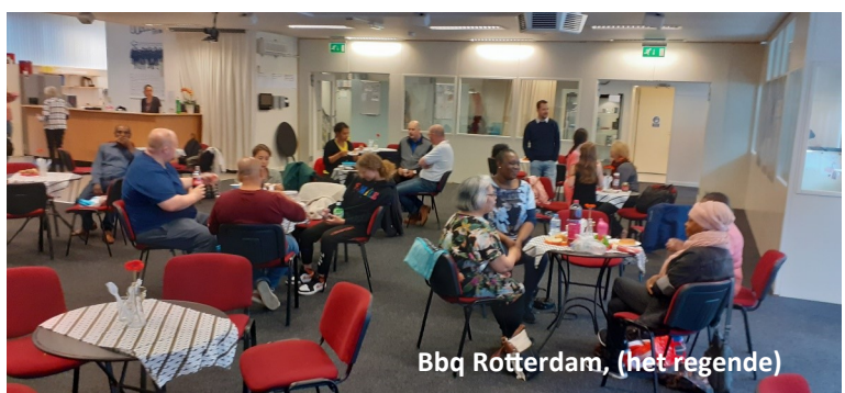
Bbq Rotterdam, (het regende)