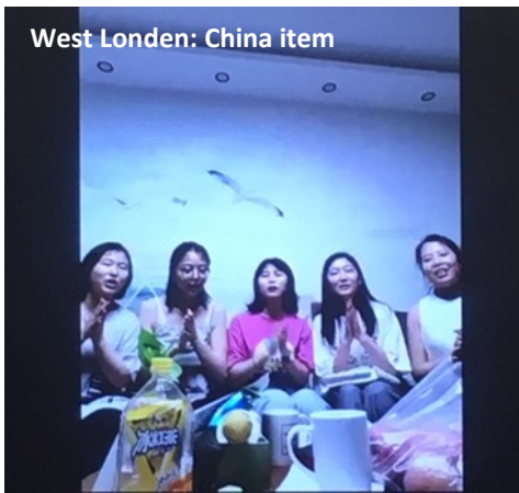
West Londen: China item

Ze kon sterke geuren niet meer ruiken en na een poosje leek het alsof het overal naar rook stonk hoewel er niemand rookte in haar omgeving. Ze werd er soms misselijk van en dus bad ze tot God om het compleet te genezen—en dat deed God ook! Haar vermogen om te ruiken kwam terug en alles is weer prima in orde, Prijs de Heer!