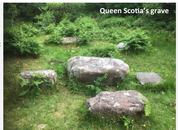
Queen Scotia's grave

Helaas wordt verondersteld dat koningin Scotia is gedood in het gevecht met de Tuatha De Dannan, maar haar naam leeft voort net zoals de oude naam voor Ierland Scotia was en later Albion werd, dat weer Schotland werd toen de Ierse Highlanders arriveerden. Maar, de grootste zegen tijdens dit uitje op een regenachtige dag was, dat toen wij op die obscure begraafplaats stonden, we een familie ontmoetten die ook naar de grafstenen stonden te kijken; wat ons de gelegenheid gaf om tegen hen te getuigen en in het kort de geschiedenis van Scotia. De familie luisterde met interesse, want de moeder had de verloren stammen van Israël bestudeerd. We konden haar natuurlijk vertellen waar zij waren en belangrijker over de Koning der Koningen Die komt om over hen te regeren en hoe in Zijn koninkrijk te komen. We proberen met deze familie in contact te blijven.