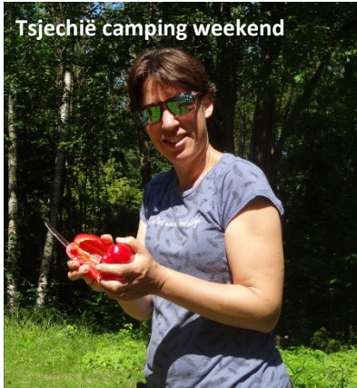
Tsjechië camping weekend