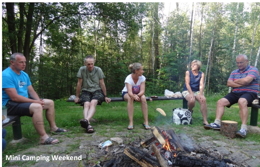
Mini Camping Weekend

Later in de maand hadden we een mini-camping weekend in de bergen. Een gezin dat te gast was hoorde veel getuigenissen en veel goed advies en aanwijzingen uit de Bijbel. We beklommen de heuvels, kookten samen buiten en zongen chorussen. Het is opbouwend om samen te zijn, over de Heer te praten en ons te richten op Zijn kracht. Prijs de Heer! Revival Fellowship Tsjechië.