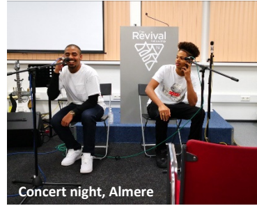
Concert night, Almere

jaar was. De ouders gingen ervoor bidden en vasten, erop vertrouwend dat alles wat de Heer maakt perfect is. Hij kent Zijn creatie het beste. Na het onderzoek op 1 jarige leeftijd was alles goed. Precies diezelfde week waren de