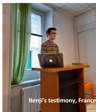
Benji's testimony, France