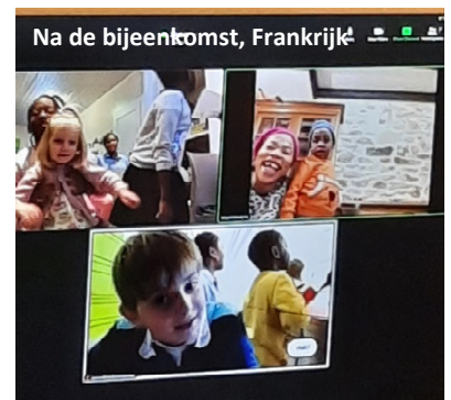
Na de bijeenkomst, Frankrijk