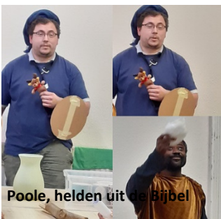
Poole, helden uit de Bijbel