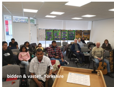
bidden & vasten, Yorkshire