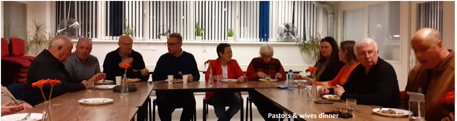
Pastors & wives dinner