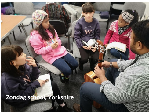
Zondag school, Yorkshire