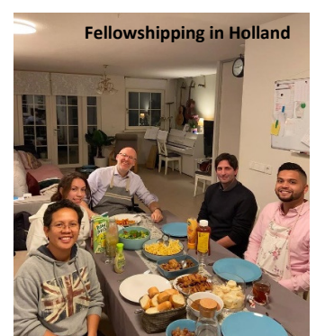
Fellowshipping in Holland