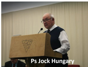
Ps Jock Hungary

Een zuster bevond zich in een heftige werksituatie. Haar baas en haar collega waren beide gestopt en lieten haar alleen. Ze hoorde van een soortgelijke getuigenis, dat gaf haar kracht en rust. Ze kon op wonderbare wijze al haar taken op tijd af krijgen.