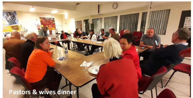
Pastors & wives dinner

Spreuken 11:14 : Als er geen wijze raadslagen zijn, vervalt het volk; maar de behoudenis is in de veelheid der raadsliden.