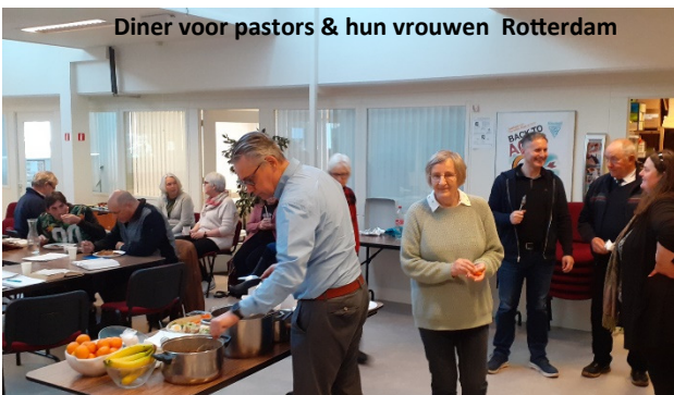
Diner voor pastors & hun vrouwen Rotterdam