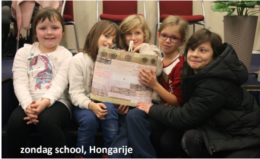
zondag school, Hongarije