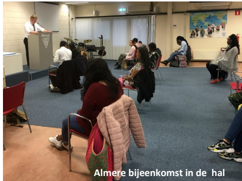
Almere bijeenkomst in de hal