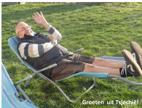
Groeten uit Tsjechië!

Eén van onze zusters is behoorlijk ziek geweest en moest in extreme isolatie blijven. Dus belde een oudere broeder haar op en zong voor haar een uur lang over de telefoon, om haar aan te moedigen en te ondersteunen. Deze broeder heeft geen techniek of internet thuis, hij kan dus ook niet mee kijken met de online bijeenkomsten, maar hij vond een speciale manier om in deze situatie te helpen. Het laat zien dat iedereen nuttig en aanmoedigend kan zijn, zelfs op een schijnbaar eenvoudige manier. Deze maand ontving onze pastor voor de derde keer een telefoontje van een man die