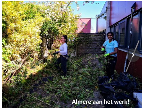
Almere aan het werk!